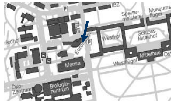
Lageplan Euroforum, Kirchnerstr. 3, 70599 Stuttgart