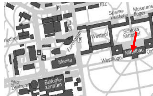
Lageplan des Balkonsaals im Schloss